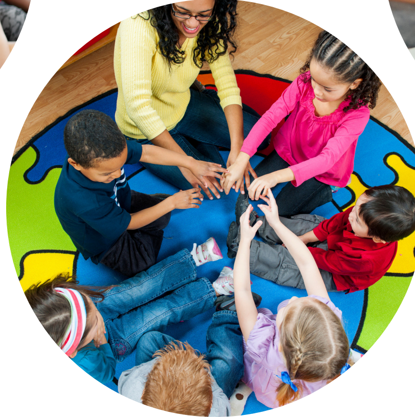
Sosyal ve Duygusal Gelişim