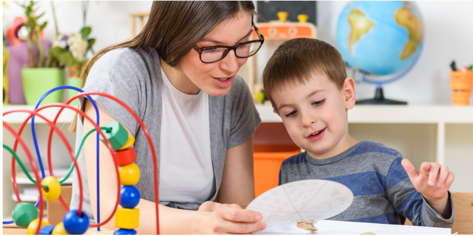
Yeni bir öğretmen