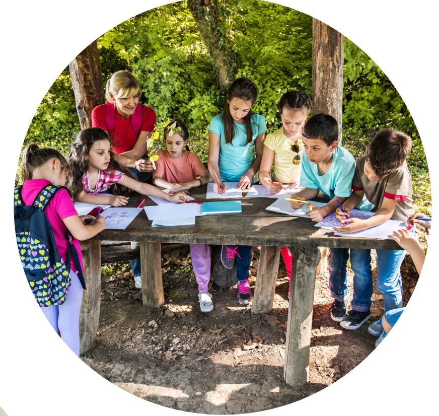
Açık Hava Etkinlikleri