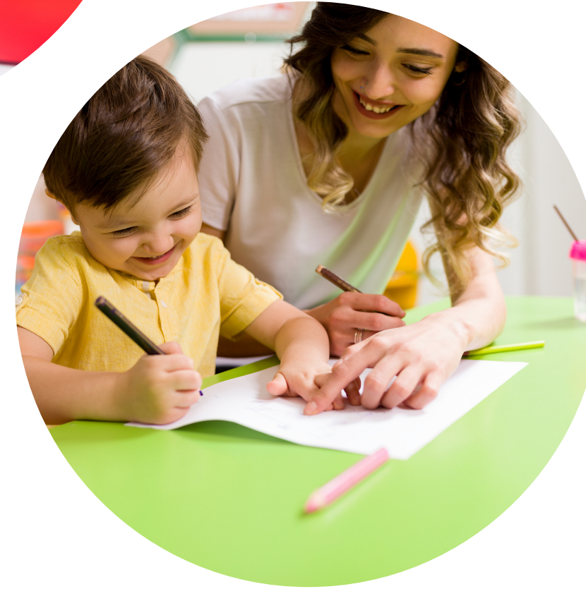
Okuma-Yazmaya Hazırlık Etkinlikleri